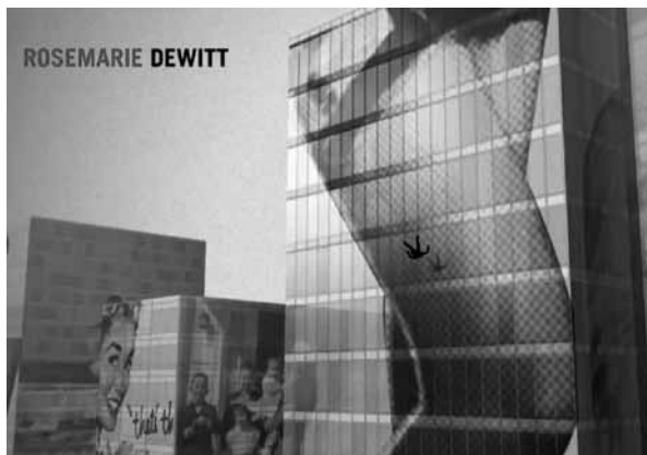
Fig. 3 – Detalhe da abertura de Mad Men: falling man

No centro desta crise de identidade nacional está o protagonista, Don Draper, ele próprio uma mentira meticulosamente construída, como um anúncio habilmente «photoshopado» 7 . Sua tortuosa jornada de autoconhecimento acontece paralelamente à jornada da própria sociedade americana.