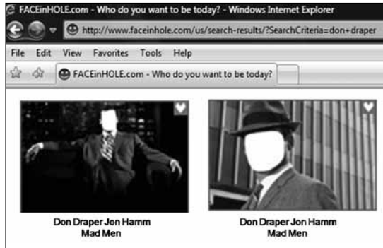
Fig. 8 – «Quem você quer ser hoje?» pergunta o site FACEinHOLE

participativa encontrou terreno fértil no ciberespaço, um marcante diferencial em relação aos fãs e consumidores passivos do século xx (Berelowitz, 2011: 4). Até mesmo o termo «audiência» é considerado por Rose ultrapassado: para ele o termo correto hoje seria «participante» (2011: 6). Se em décadas passadas vestir a camiseta ou o boné era suficiente, na nova era somos convidados a vestir o próprio rosto do objeto de adoração.