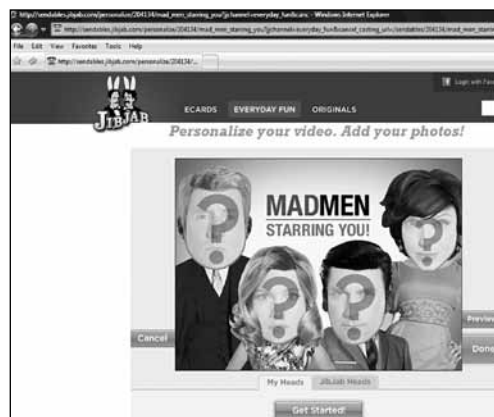
Fig. 7 – Vídeo interativo «Você estrelando em Mad Men »

Esta categoria surgiu durante a era da TV II, mas foi durante a TV III que este tipo de público altamente comprometido se tornou mais significativo. Assim, quanto mais disputada a atenção dos telespectadores, maior a pressão para criar programas que inspirem engajamento, e maior é a importância do branding para