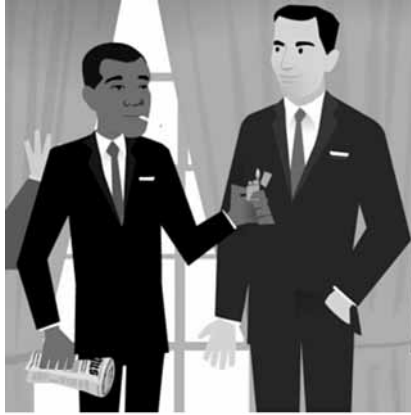
Fig. 6 – Barack Obama e Don Draper, no site Jezebel

jornalista em sua versão Mad Men , ou de celebridades (Fig. 6). Foram publicadas entrevistas com Dyna Moe, que lançou paralelamente seu livro-tributo à série, Mad Men: The Illustrated World . Para citar Mark Zuckerberg, fundador do Facebook: «Empurrar uma mensagem para cima das pessoas já não é mais suficiente. É preciso conseguir que a mensagem se instale na conversa» (citado em Sibilia, 2008: 21). A AMC havia assim acertado a estratégia, brindando os fãs com um novo portal de entrada para o universo da série através da arte de uma insider , uma fã como eles.