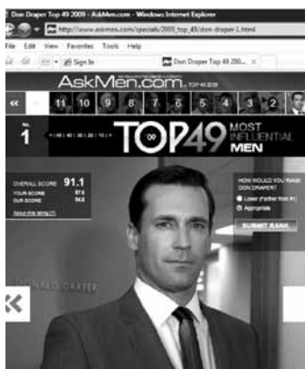
Fig. 1 – Pesquisa AskMen.com

A proposta deste artigo é examinar o comportamento dos fãs de TV na sociedade contemporânea ocidental, que elege como objeto de adoração e emulação uma figura duplamente fictícia, não apenas o personagem de uma história, mas um personagem inventado por outro personagem. O que isto diz sobre a cultura e o ambiente midiático do século XXI? E que impacto tem sobre o marketing