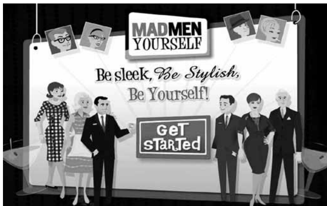
Fig. 5 – O site MadMenYourself

Como a audiência de Mad Men nos Estados Unidos foi apontada como a mais rica da TV a cabo – praticamente 50% possui uma renda anual acima de 100 mil dólares (Armstrong, 2010) –, a AMC tinha certamente um trunfo nas mãos. Se uma emissora tem o privilégio de possuir uma audiência tão qualificada, especialmente em tempos de crise econômica, é fundamental que a mantenha fiel.