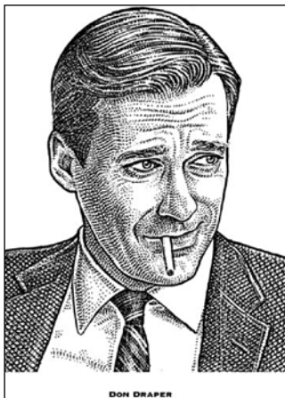
Fig. 9 – Don ganha uma ilustração com bico de pena no Wall Street Journal , marca registrada da publicação de negócios

pode ser exibida e vendida, em blogues ou sites como o Ebay. O novo fã não é um telespectador: é um participante, constantemente convidado a imergir via múltiplos pontos de entrada. Ele é também inerentemente narcisista, como defende Ian Schafer, CEO da Deep Focus (citado em Molitor, 2010). As mídias sociais são a nova vitrine interativa onde estes participantes e seus avatares disputam espaço, produzem e consomem conteúdo e buscam novas formas de gratificação. O fã ávido transmidiático não quer apenas criar e compartilhar; ele quer ser visto criando e compartilhando.